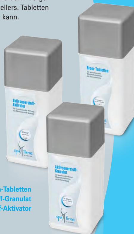
Brom-Tabletten Aktivsauerstoff-Granulat Aktivsauerstoff-Aktivator

Wichtig: Zur Verstärkung der Wirksamkeit des Granulats müssen Sie zusätzlich Aktivsauerstoff-Aktivator verwenden.