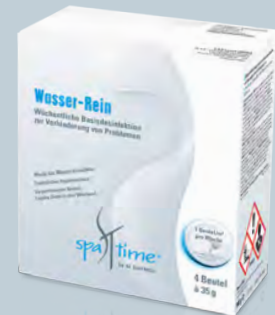
Wasser-Rein Karton mit 4 Beuteln à 35 g

Dieses Produkt ist bei allen drei Pflegemethoden Chlor, chlorfrei auf Basis Aktivsauerstoff oder Brom einsetzbar.