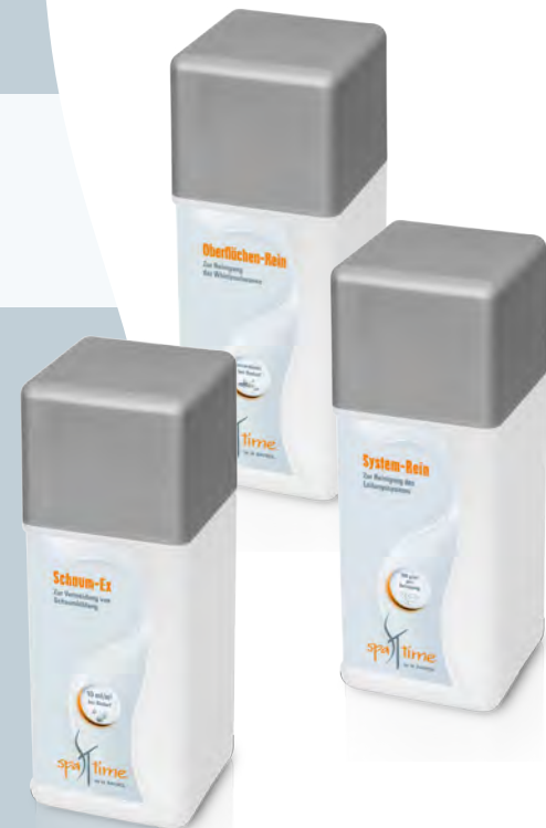
Oberflächen-Rein System-Rein Schaum-Ex

Schaum auf der Wasseroberfläche sieht nicht sehr einladend aus. Falls Ihr Whirlpoolwasser zur Schaumbildung neigt, empfehlen wir Ihnen die Zugabe von Schaum-Ex . Die Dosierung erfolgt direkt ins Whirlpoolwasser. Schäumt das Wasser nach der Zugabe immer noch, sollte es gewechselt werden.